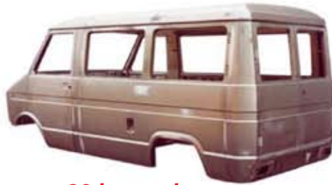
80-luvun alun DAILY IVEVO auton kori, IVECO ORLANDI linja-auto