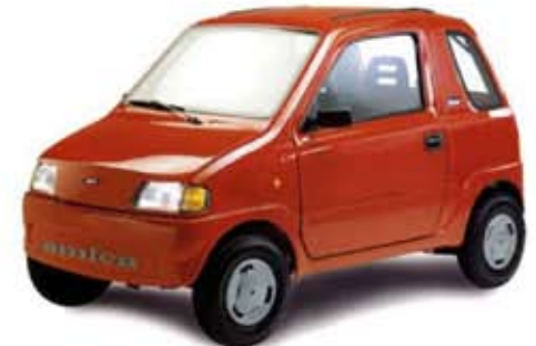
1996 AMICA LUNA mopoauto