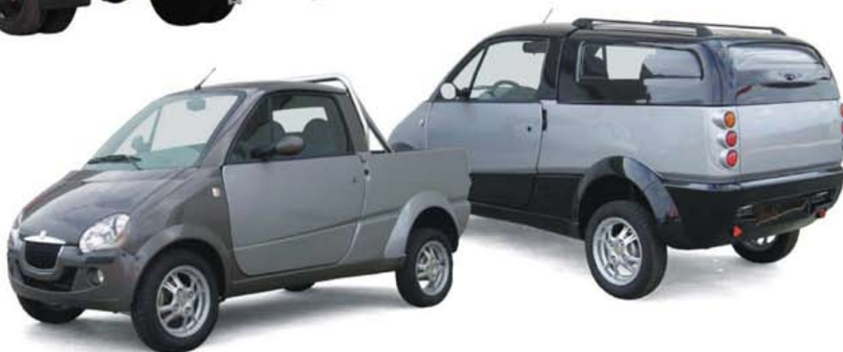
2005 EKE Stile Pick-up, Van ja SW mallit