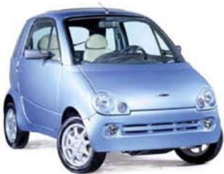
2000 EKE mopoauto