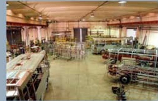
Linja-autojen valmistuslinja 80-luvulla