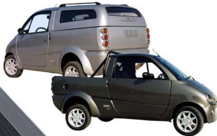
2004 EKE Pick-up, Van ja SW mallit