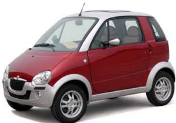
2005 EKE Stile mopoauto