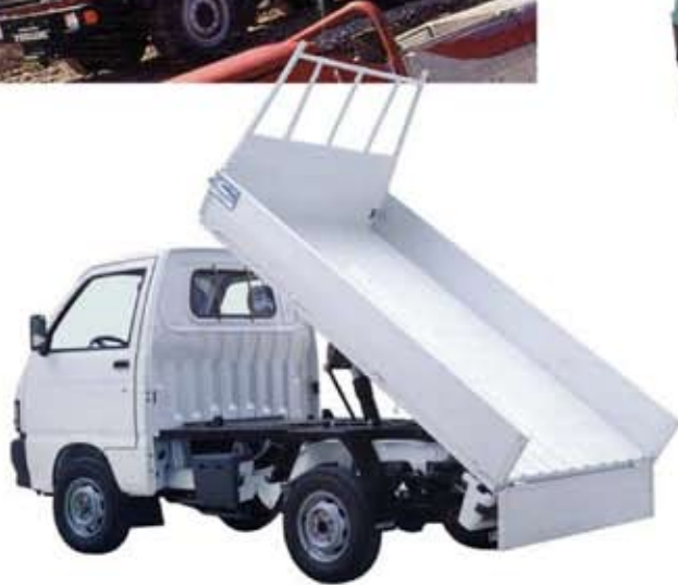
1994 PORTER PIAGGIO:n osat