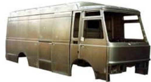
70-luvun IVECO pakettiauto 80-luvun lopun PERLINI hytti

GRECAV yhtiöllä on 40 vuoden vankka kokemus ajoneuvojen suunnittelusta ja valmistuksesta.