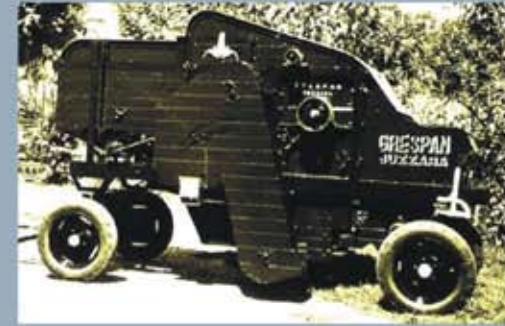
Puimuri vuodelta 1956