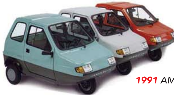
1991 AMICA mopoautot