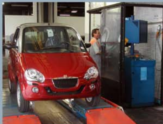
Ajoneuvon luovutustarkistuksen vaiheita