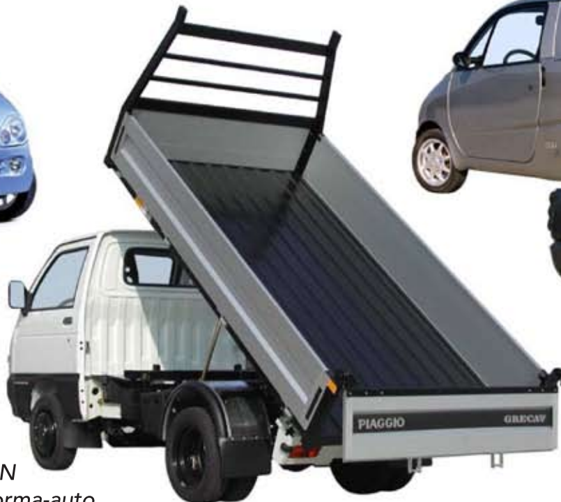
2002 GRECAV 2,2 TON Porter Maxxi kevytkuorma-auto