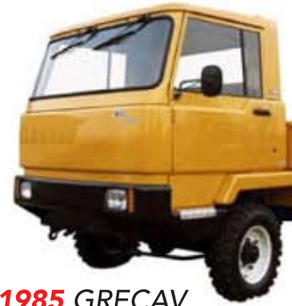
1985 GRECAV kuorma-auto