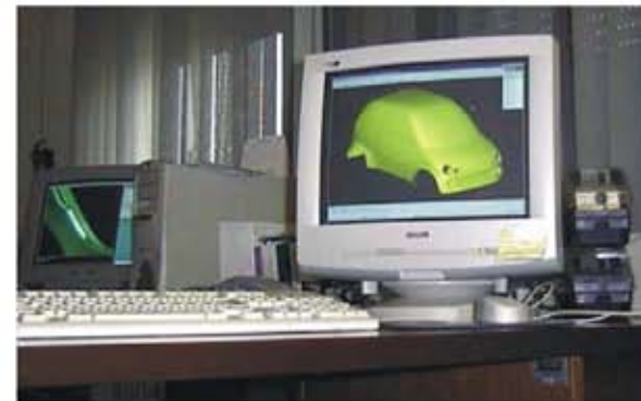
3D CAD/CAE suunnitteluohjelmisto

Jokaisella GRECAV tuotantolinjalla työskentelevät alansa asiantuntijat, ja laatupäälliköt raportoivat ja valvovat tuotteiden jokaista valmistusvaihetta.